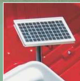
Placa Solar para recarga de bateria