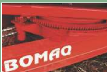
Giro Hidráulico do cavalete e carretel