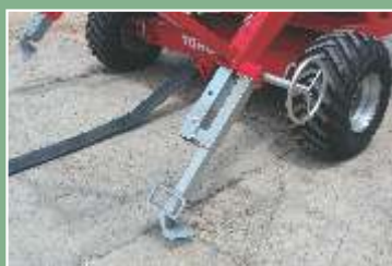
Redutor mecânico para levante das âncoras e sistema de entrada de água pelo chassi