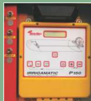
Painel eletrônico de controle de velocidade